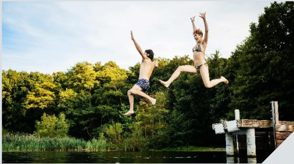
Native Story Paket